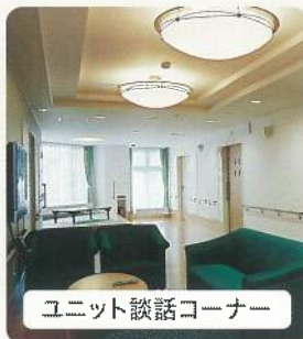
ユニット談話コーナー