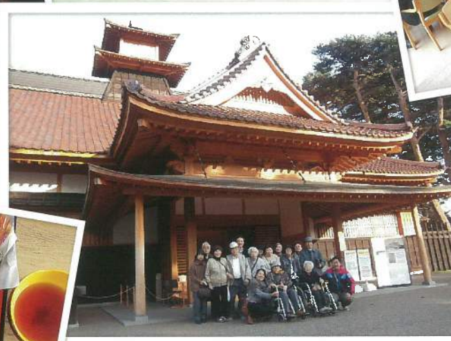
外出レクリエーション