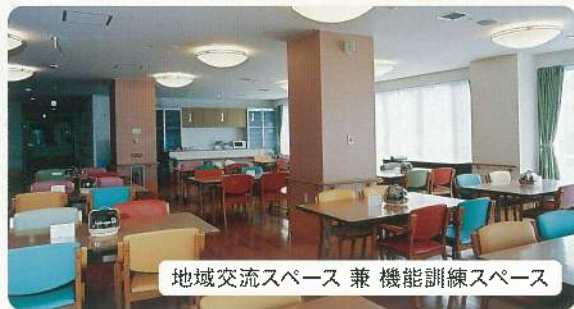
地域交流スペース 兼 機能訓練スペース