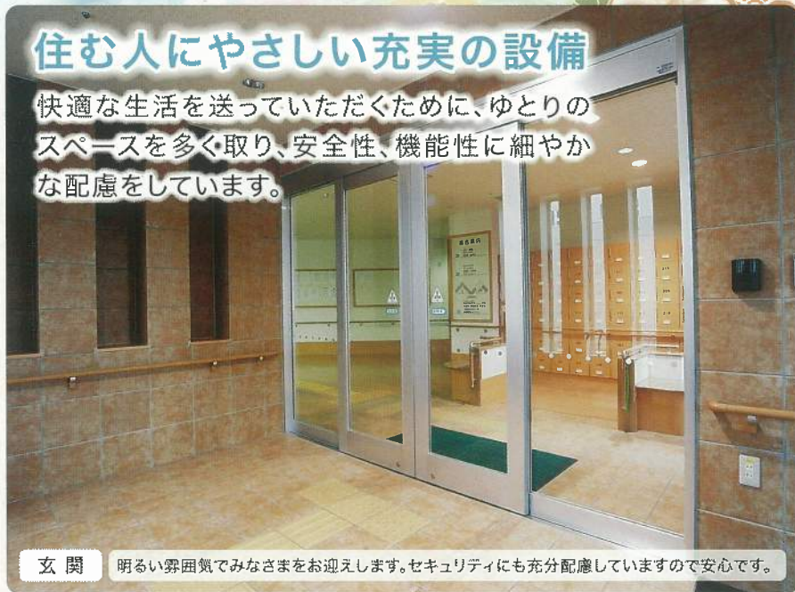
玄関 明るい雰囲気でお迎えします。セキュリティにも充分配慮していますので安心です。

快適な生活を送っていただくために、ゆとりのスペースを多く取り、安全性、機能性に細やかな配慮をしています。